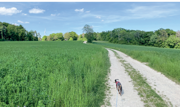
Entspannung pur: Die Wanderung führt über Feld, durch Wald und über Wiesen.

Beiz Büttenhardt, 052 649 20 75, www.beiz-buettenhardt.ch Restaurant Kuhstall, Lohn, 052 640 09 39, www.kuhstall-lohn.ch Restaurant Sternen, Lohn, 052 649 33 01 Café Kaphilon, Lohn, 077 447 54 08