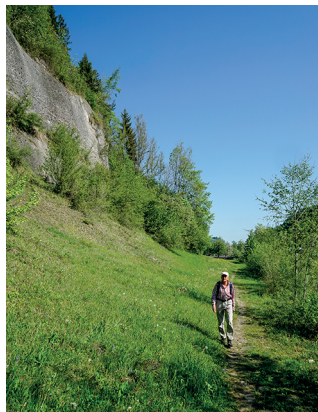
Eindruckliche Nagelfluhwände kurz nach dem Start.