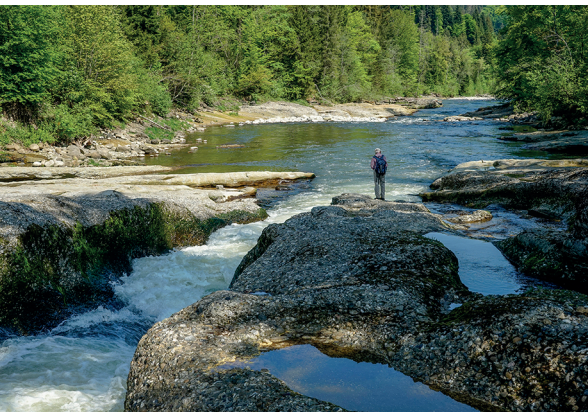
Spektakuläres Flussbett der Kleinen Emme oberhalb der Kappelbodenbrücke.

Erreichbar ist «Wolhusen, Neuemsern-Rossei» mit dem Postauto ab Wolhusen. Hasle liegt an der Bahnlinie Luzern-Langnau i.E. Grillstube Rossei, 079 415 48 63, www.grillstube-rossei.ch