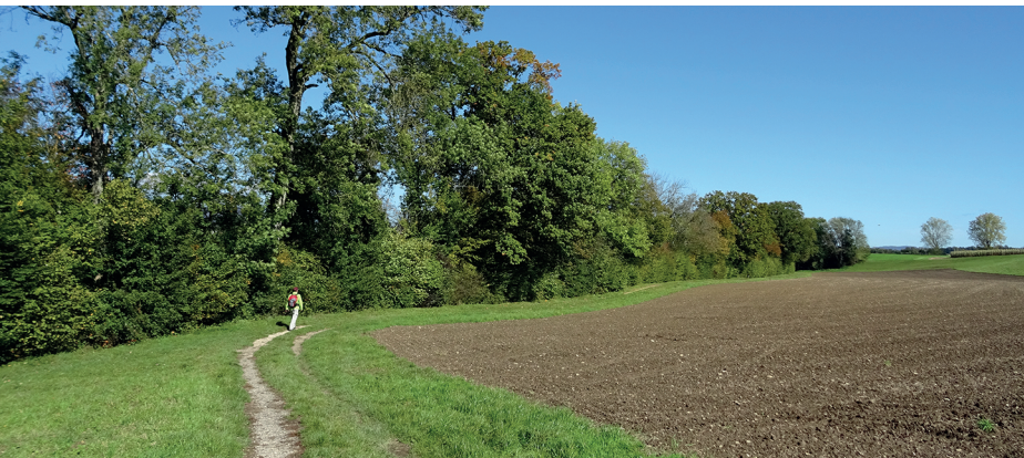
Bei Oberwynaun führt ein einladender Uferweg der Aare entlang.

Restaurant Rössli, Oberwynaun, 062 929 80 80 (500 m vom Wanderweg entfernt)