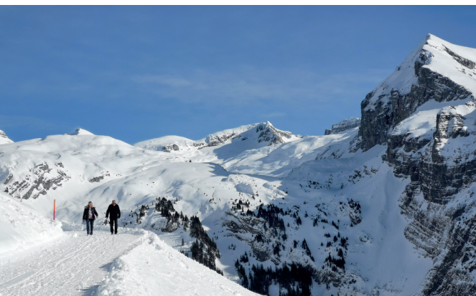
Im Abstieg von der Brunnihütte nach Ristis, Ausblick ins Griessental, rechts Gross Gemsisipil.