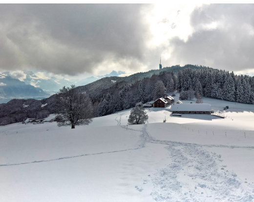
Ausblick vom Mont Chesau nach Süden hinüber zum Mont Pèlerin.

Restaurant L'Aigle gourmand, Le Mont-Pèlerin, 021 922 27 61, www.saveurs-et-couleurs.ch Rail Center MOB, Montreux, 021 989 81 90, www.goldenpass.ch