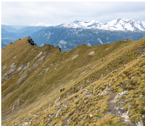
In der steilen Flanke, die zum Montalin hinaufführt.