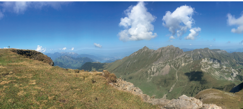
Kaiserliches Rundumpanorama auf dem Chaiserstuel. Der Gipfel ist so breit, dass es sich anbietet, hier zu picknicken.

Restaurant Kreuzhütte, 041 628 23 09, www.berghof.ch