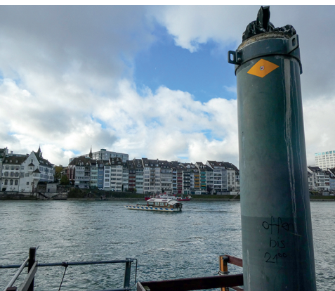
Der Wanderweg, der übers Wasser führt – genauer über die Vogel-Gryff-Fähre.

Fähre, 079 659 63 67, www.vogel-gryff-faehri.ch Diverse Restaurants auf der ganzen Wanderung Tierpark Lange Erlen mit Parkrestaurant, 061 681 43 44, www.erlen-verein.ch