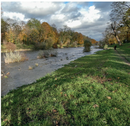
Zum Schluss geht es der Wiese entlang zum Tierpark.