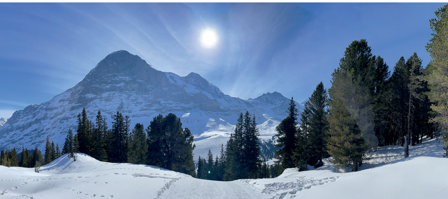
Das Dreigestirn ist kurz vor Bustiglen als Ganzes sichtbar.

Berghaus Männlichen, 033 853 10 68, www.berghaus-maennlichen.ch Bergrestaurant Kleine Scheidegg, 033 828 76 92, www.bergrestaurant-kleine-scheidegg.ch Hotel Bellevue des Alpes, 033 855 12 12, www.scheidegg-hotels.ch