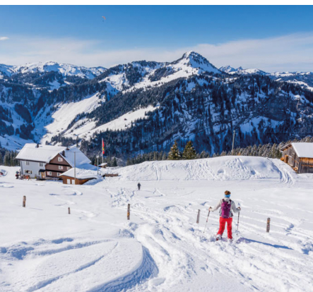
Nach dem Abstecher zur Kapelle geht es hinunter zur Druesberghütte.

Erreichbar ist Hoch-Ybrig, Talst. Weglosen mit dem Bus von Einsiedeln. Bei der Druesberghütte können Schlitten, Snow-Gämel oder Schneeträml gemietet werden. www.druesberghuette.ch