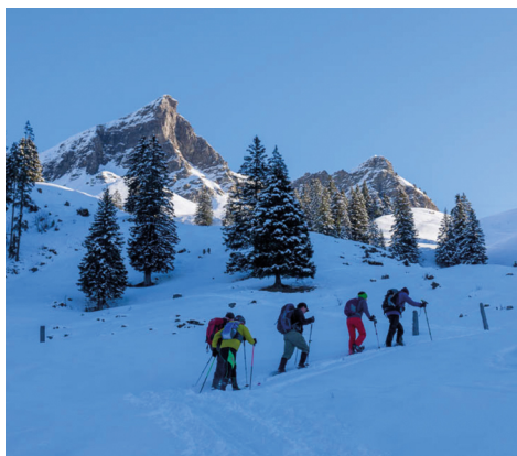
Querfeldein geht es über tief verschneite Alpweiden hoch.