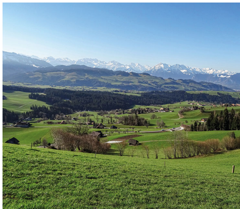
Aussicht auf die Stockhornkette kurz vor der Falkenfluh.