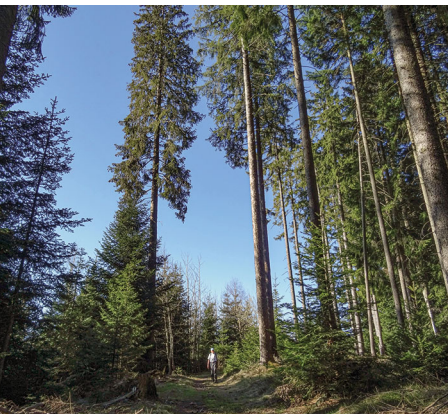
Riesige Fichten flankieren den Wanderweg auf der Schafegg.

Erreichbar ist Linden mit dem Bus vom Bahnhof Oberdiessbach. Rückreise mit dem Zug vom Bahnhof Oberdiessbach. Hotel-Gasthof Linde, 031 771 03 17, www.linde-linden.ch