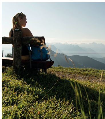
Zahlreiche Bänkli und Restaurants machen diese Wanderung gemächlich.