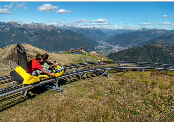
Ob die beiden Rodel-Piloten wohl Zeit haben für den Blick über die Alpe Foppa nach Bellinzona?

Monte Tamaro, 091 946 23 03, www.montetamaro.ch