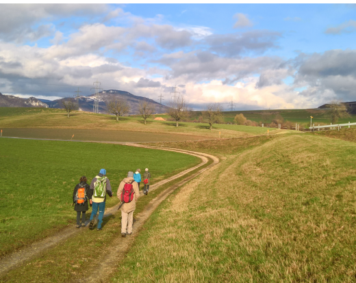
Eine Wandergruppe auf dem Weg von Oberbipp zum Längwald.