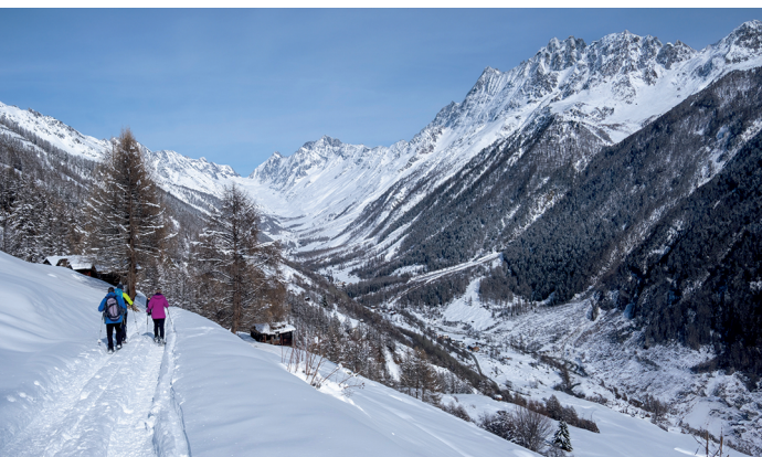
Lichtungen im Lärchenwald geben den Blick frei auf die Lötschenlücke.

Restaurant Sporting, Wiler, 027 939 13 77, www.sportingii.ch