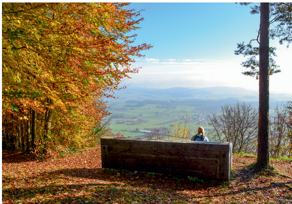
Auf dieser Aussichtsbank am Imebärg hätte eine ganze Wandergruppe Platz.