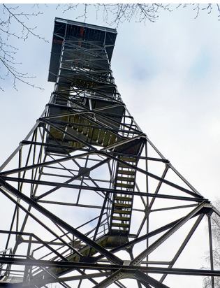
Der Stäälibuckturm wurde als Bachtungsposten genutzt.

Erreichbar ist Lustdorf mit dem Bus von Frauenfeld oder Weinfelden. Restaurant Stählibuck, Dingehart, 052 721 27 13, www.restaurantstaehlibuck.ch