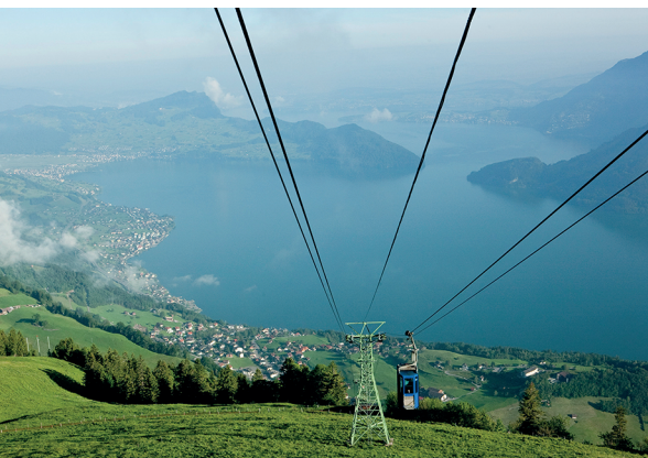
Luftseilbahn Emmetten-Stn. Niederbauen mit Blick auf Vierwaldstättersee und Bürgenstock.

Luftseilbahn Dallenwil-Niederrickenbach, www.maria-rickenbach.ch Bergasthaus Niederbauen, www.berggasthaus-niederbauen.ch