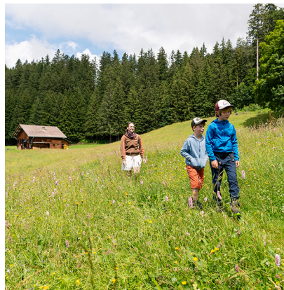
Der Weg führt durch Matten und Wälder.