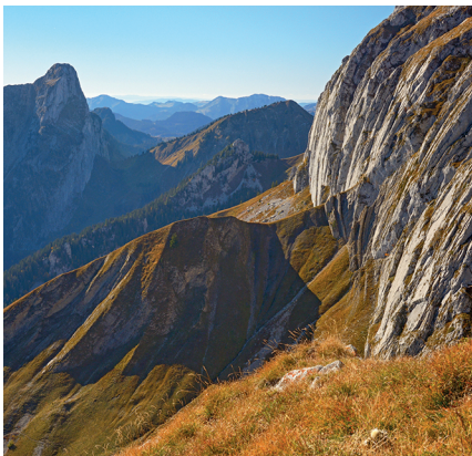
Der Blick zurück auf die elegant geschwungenen Felsen und die Dent d'Oche.