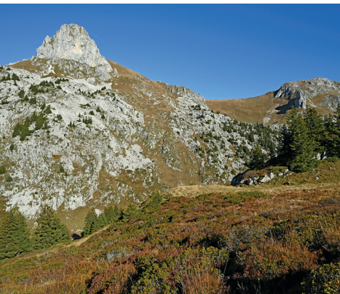
Die Landschaft auf Taney prägen spitzige weisse Felszacken.

Refuge du Grammont, Lac de Taney, 024 481 11 83, www.le-grammont.ch Auberge Refuge La Vouivre, Lac de Taney, 024 481 14 80, www.lactaney.com La Petite Auberge Baabuk, Lac de Taney, 079 542 32 03, www.lacdetaney.ch