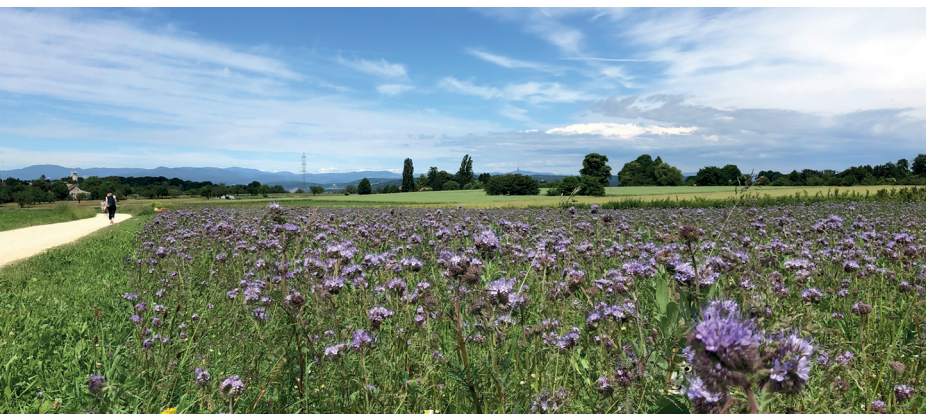
Frühling pur: wandern entlang von Blumenfeldern im Spitzehegli auf dem Bruederholz.

Restaurant Predigerhof, 061 262 21 12, www.restaurant-predigerhof.ch Hofrestaurant Schällenursli, offen von Mai bis September, 061 564 66 77, www.schaellenursli.ch