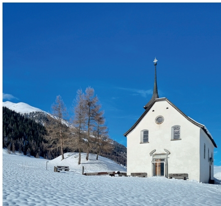
Die Feldkapelle zwischen Ritzingen und Gluringen strahlt mit dem Schnee um die Wette.