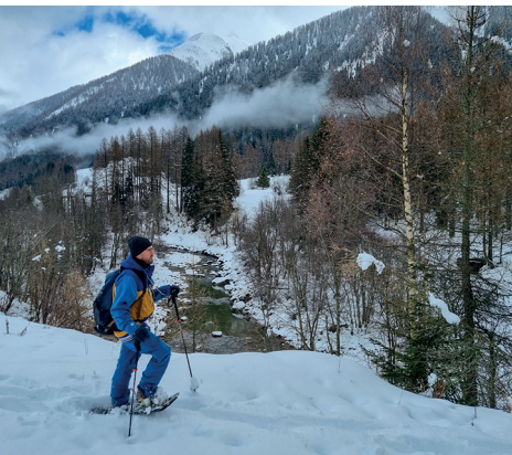
Die Schneeschuhwanderung führt entlang dem Ufer der Rotte. Bilder: Nathalie Stöckli

Hotel Restaurant Tenne, Gluringen, 027 973 18 92, www.tenne.ch Olympia Sport – Gade-Bar, Blitzingen, 027 971 03 30, www.olympia-sport.ch