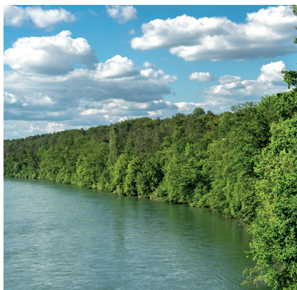
Nur Wasser und Grün: Die Aare lässt auch dem Wanderer keinen Platz am Ufer.