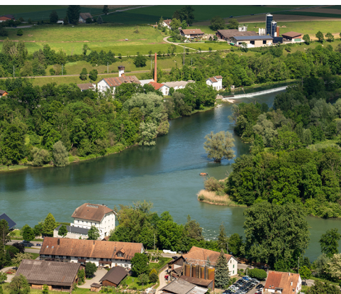
Vom Bruggerberg ist gut sichtbar, wie die Limmat in die Aare mündet.

Erreichbar ist Brugg mit dem Zug über Olten, Basel und Zürich. Nach Turgi fährt der Zug über Baden und Brugg. Restaurant Chämihütte, Untersiggenthal, 056 298 10 35, www.chaemihuette.ch