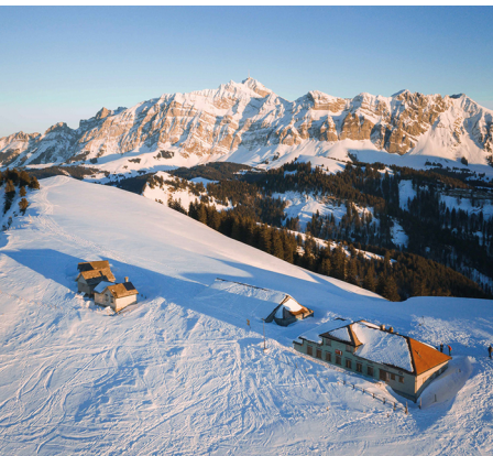
Die Hochalp ist wunderbar gelegen. Hinten der Säntis.

Gasthaus Hochalp, im Winter Öffnungszeiten telefonisch: 071 364 11 15