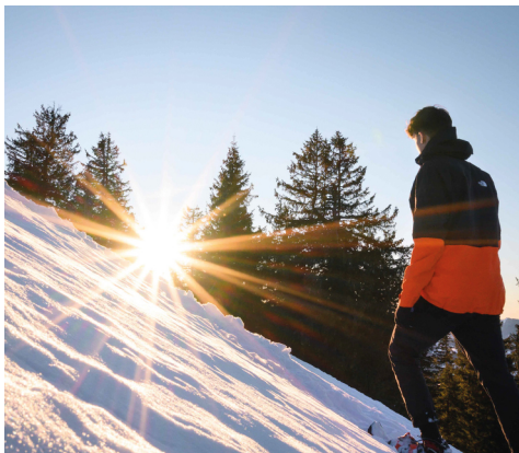
Ein lauschiges Wäldchen kurz vor dem steileren Aufstieg zur Hochalp.