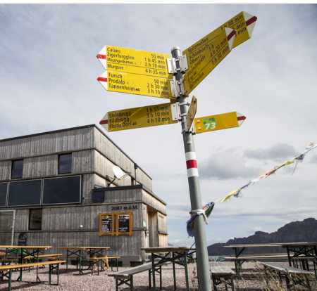
Von der Spitzmeilenhütte führen Wege in alle Himmelsrichtungen.