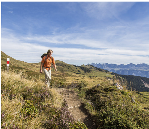
Auf dem Weg vom Maschgenkamm zur Spitzmeilenhütte.