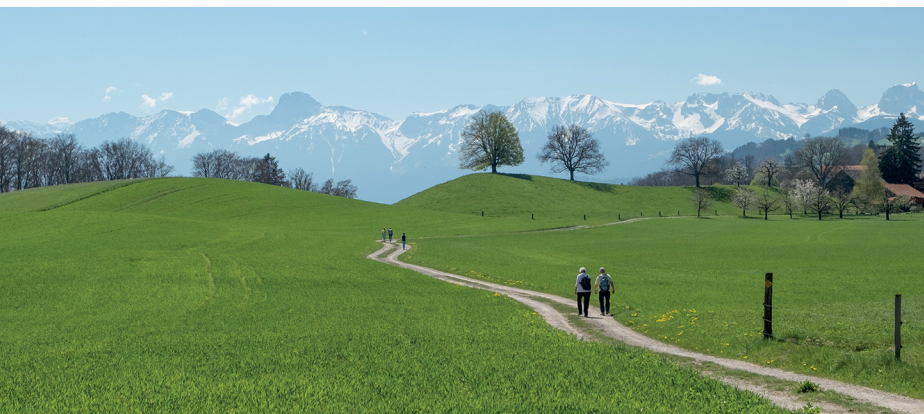
Kurz vor dem Weiler Hofmatt: sattgrüne Wiesen vor schneebedeckten Gipfeln.

Bäckerei-Café Zät Sibe, Kehrsatz, 031 961 19 46 Restaurant Änglichsbärg, Wohnheim Kühlewil, https://kuehlewil.ch/ Restaurant Linde, Kaufdorf, 031 802 04 64, www.lindekaufdorf.ch/