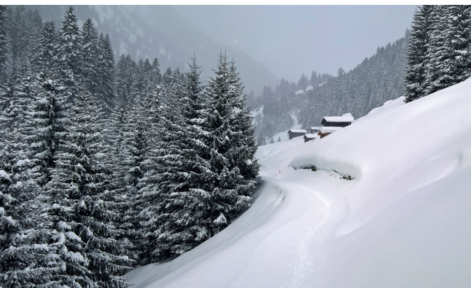
Im Tal des Bachs Flem, unterhalb der Alp da Stiars.

Bergbahnen Brigels, 081 920 14 24 www.brigels-bergbahnen.ch