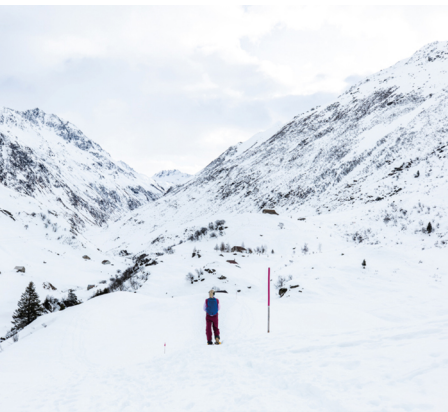
In den Weiten des Tals lässt es sich entspannen und tief durchatmen.

Vom Bahnhof zum Startort sind es rund fünf Gehminuten. Ansonsten fährt im Halbstundentakt der Bus die zur Station «Brücke» an. Dieser benötigt jedoch 15 Minuten für dieselbe Strecke. Etlliche Verpflegungsmöglichkeiten im Dorf.