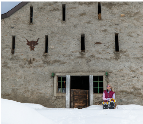
Bei einem Snack lässt sich die Wintersonne an der warmen Hauswand geniessen.