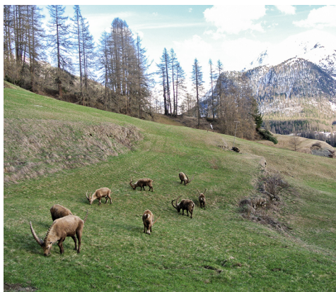
Seelenruhig grasen die Steinböcke und scheren sich nicht um Beobachter.