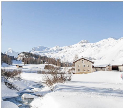
In Fex Platta zeigt die Ebene ihren vollen Charme.