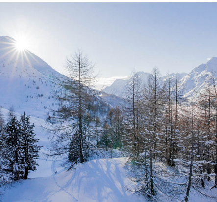
Die Aussicht auf der Plattform Güvè ist atemberaubend.

Erreichbar ist Sils/Segl Maria, Posta mit dem Bus von St.Moritz.