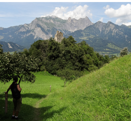
Ein Höhepunkt im wahrsten Sinne des Wortes: die Burgruine Wartenstein.

Altes Bad Pfäfers, 081 302 71 61, www.altes-bad-pfaefers.ch