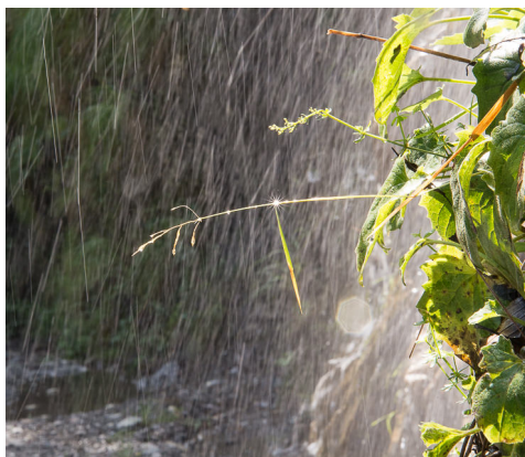
Der Anfang steht im Zeichen des Wassers.