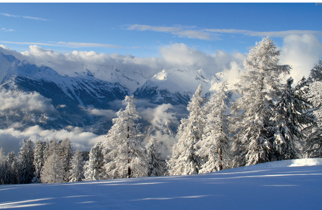
Im Winter glitzern die schneebedeckten Lärchen in der Sonne und sorgen für ein beeindruckendes Panorama.