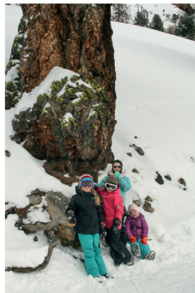
Unter dem Baumriesen fühlt man sich ganz klein.