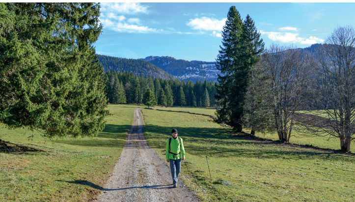
Auf dem Weg zurück nach St-Olivier. Im Hintergrund sind die Felsen des Chasseron sichtbar.

Hotels und Restaurants in Côte aux Fées, Fleurier.