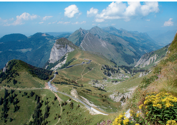
Die Zahnradbahn fährt von Montreux bis auf den Rochers-de-Naye.

Montreux-Berner Oberland-Bahn (MOB), Rail Center, 021 989 81 90, www.mob.ch