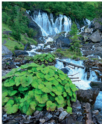
Bi de Sibe Brünne stürzen zahlreiche kleine Wasserfälle aus dem Berg.