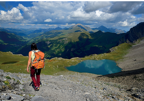
Magische Ruhe des Flueseeli: Hier liegt der Wanderin das Simmental zu Füssen.

Fluhseehütte (unbewartet, nur Übernachten möglich), 078 926 08 92, www.fluhsee.ch