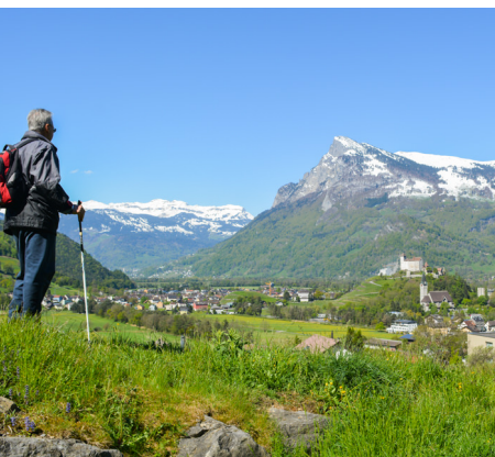
70 Meter über dem Rheintal zieht die Burg Gutenberg die Aufmerksamkeit auf sich.

Restaurant Alte Eiche, 00423 392 26 86, www.alteeiche.li Hotel Garni Säga, 00423 392 43 77, www.saega.li