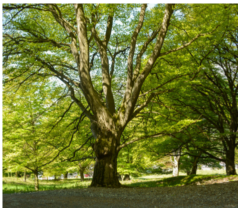
Knorrige alte Buchen laden zum Verweilen auf der Balzserer Allmend.