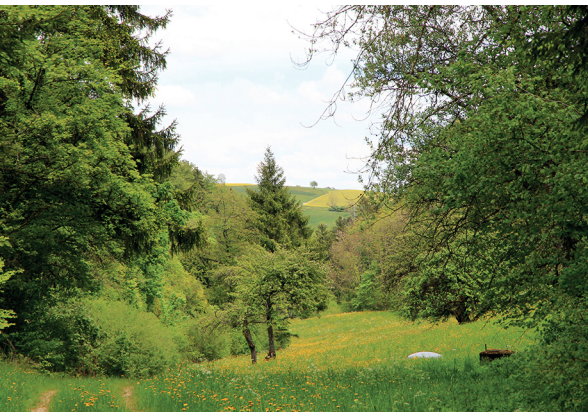
Das wildromantische Müllital.

Restaurant Krone, Barga, 052 653 15 00 Gasthof zur Krone, Neuhaus am Randen (D), 0049 7736 523