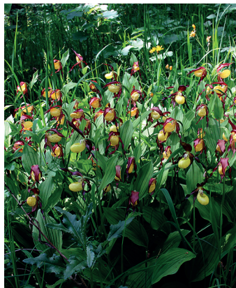
Die Frauenschuhe im Tannbüel sind nur während weniger Wochen zu bestaunen.