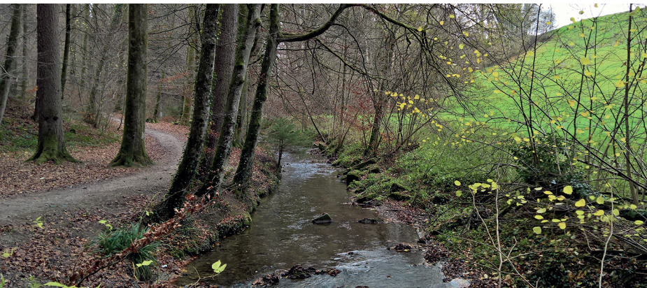
Frei und ungehindert fließt der Gäbelbach nahe dem Berner Stadtquartier Brünnen durch ein unverbautes Bachbett.

Restaurant Bahnhof, Rosshäusern, 031 751 01 84, www.restbahnhof.ch Restaurant Gartäbeiz Eymatt 62, 031 901 10 07, www.eymatt62.ch