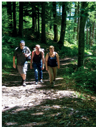
Der Wanderweg verläuft zum Teil auf der historischen Pflastersteinstrasse.