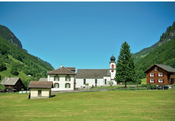
Weisstannen: Ganz hinten öffnet sich das Tal von Neuem.

Gasthaus Alpenrösli, Vermol, 081 723 17 71