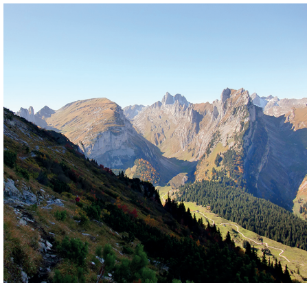
Aussicht auf das Alpstein und den Säntis.