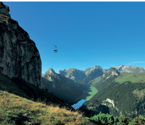
Die Seilbahn bringt den Wanderer auf den Hohen Kasten.

Erreichbar ist «Hoher Kasten» mit der Seilbahn von Brülisau aus. Von Brülisau fährt der Bus an den Bahnhof von Weissbad.