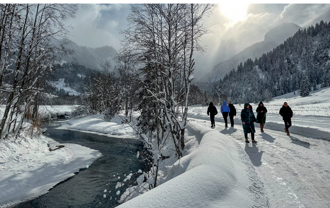
Der Winterwanderweg führt dem Louwibach entlang.

Restaurant Alpenland, 033 765 55 66, www.alpenland.ch Bochtehus Beizli, 033 765 30 34, www.bochtehus-beizli.ch