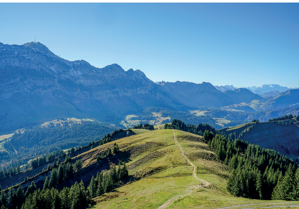
Der Sämtis, allgegenwärtig, vom Kronberg aus gesehen. Der Weg im Vordergrund führt zur Schwägälp.