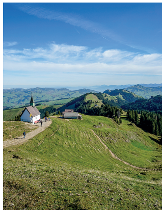
Von der Kapelle St. Jakob erkennt man den weiteren Verlauf des Grates.