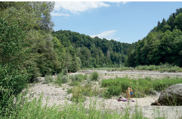
Nach der Mündung in die Sense wird das Tal breiter.

Riesens Rastplatz, Bauernhof-Kiosk kurz nach Hinterfultigen (Krommen), 031 809 35 15 Pizzeria Café SenseMare, Sensematt, 031 889 16 06, www.sensemare.ch Restaurant Sensebeach, Sensematt, 031 882 01 52, www.sensebeach.ch