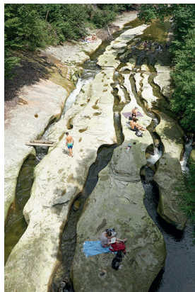
Das Wasser hat pittoreske Spuren hinterlassen.