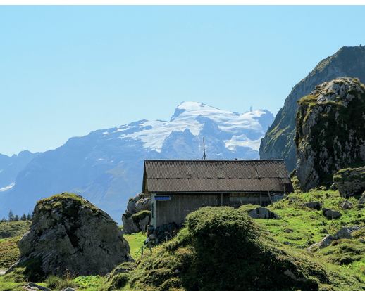
Die Wanderung führt dem Fuss des Widderfeld Stocks entlang zur Alp Lutersee.

Kleinseilbahn Mettlen-Lutersee, 041 637 24 33 Gasthaus Grafenort, 041 639 60 90, www.gasthaus-grafenort.com