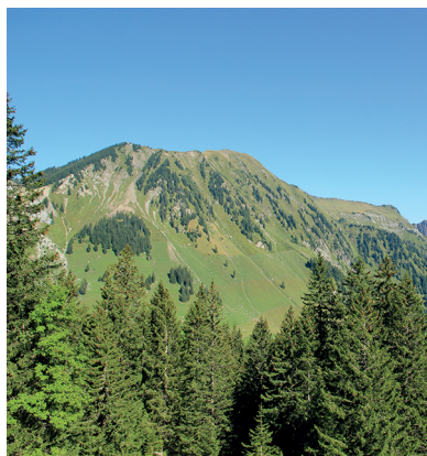
Am Steinigberg unterscheiden sich die Planggen farblich vom Weideland.