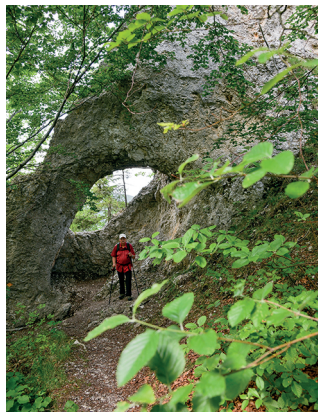
Der Abstieg über die Gerstellflue führt durch einen Felstunnel.