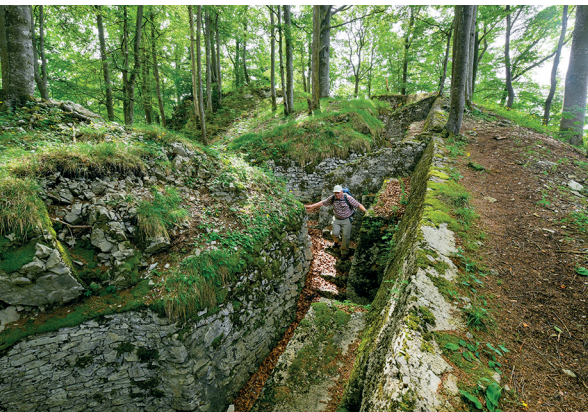
In den Schützengräben am Spitzenflüeli kann man die Grösse der Fortifikation Hauenstein erahnen.

Die Befestigungsanlagen entlang des Wegs im Überblick: www.wandern.ch/hauenstein