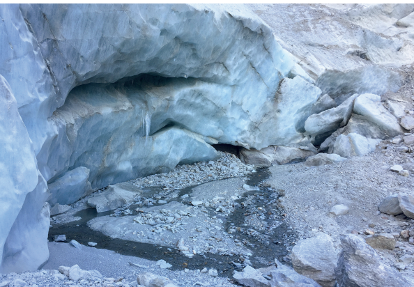
Beim Gletschertor des Riedgletschers.

Erreichbar sind «Gasenried, Dorfplatz» und «Grächen, Post» mit dem Bus über St. Niklaus. Mehrere Restaurants in Grächen