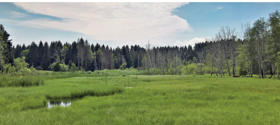
Le site marécageux des Mosses, à La Rogivue.

On accède à Châtel-St-Denis en train depuis Bulle ou Palézieux. Depuis Oron-la-Ville, des bus circulent vers Palézieux ou Romont (FR).