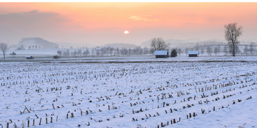
Le Wauwilermoos: l'ancien lac est une réserve naturelle.

Gasthof St. Mauritz, Schötz, 041 980 44 22, www.stmauritz.ch