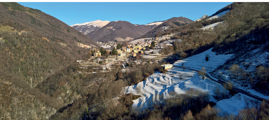
Un soupçon de neige recouvre les environs de Bruzella.

Grotto del Tiro, Caneggio, 091 684 12 40 Restaurant Lattecaldo, Morbio Superiore, 091 684 12 40, www.ristorantelattecaldo.ch