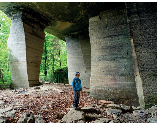
On se sent tout petit entre les piliers de l'ancienne carrière.

Société de tir de Staffelbach: www.sg-staffelbach.ch