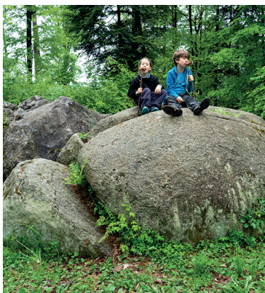
Deux blocs erratiques et deux pique-niqueurs.