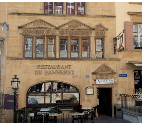
Au centre de Neuchâtel, la pierre jaune est partout. Ici à l'hôtel du Banneret, construit au 17e siècle.

Crêpes Factory, Saint-Blaise, 076 389 47 00 Restaurant Ikuru, Saint-Blaise, 032 753 08 41