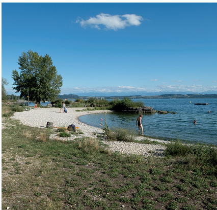
La randonnée offre plusieurs points de baignade, par exemple à Saint-Blaise.